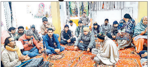
झज्जर। श्री सुंदरकांड पाठ के उपरांत भजनों का आनंद लेते हुए श्रद्धालु।