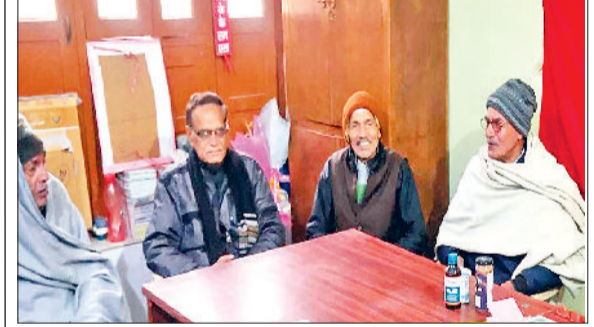
बहादुरगढ़। बैठक में परेड को लेकर चर्चा करते संगठन के सदस्य।