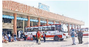
बहादुरगढ़। अड्डे पर खड़ी बस और आपसब बेटे यात्री।

दरअसल, मांगों को लेकर रोडवेज कर्मचारियों द्वारा बुधवार को चक्का जाम का एलान किया गया था। हरियाणा के कई शहरों में कर्मचारियों ने हड़ताल की लेकिन बहादुरगढ़ सब डिपो के कर्मचारियों ने फिलहाल दूरी बनाए रखी। कुछ कर्मचारियों से बात हुई तो उन्होंने हड़ताल में शामिल होने से इंकार कर दिया, लेकिन मांगों को जरूर सही ठहराया। बहादुरगढ़ सब डिपो में लगभग सभी कर्मचारी आए थे। यहाँ रोडवेज की 74 और 10 लीज की बसें हैं। ये सभी बसें निर्धारित समय पर सवारियाँ लेकर अपने रूटों के लिए निकलीं। बेशक यहाँ के कर्मचारियों ने