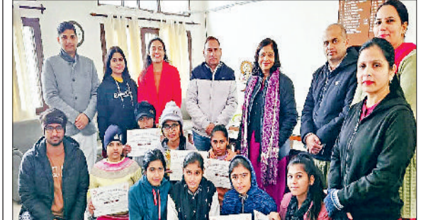
बहादुरगढ़। विजेता व प्रतिभागी छात्रों के साथ कॉलेज स्टाफ।