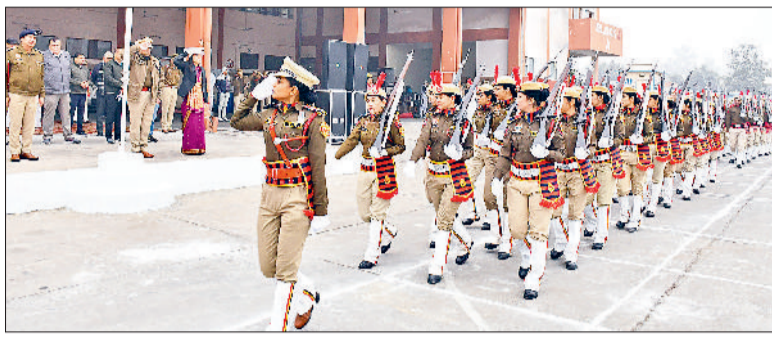
झज्जर। गणतंत्र दिवस समारोह की फाइनल रिहर्सल के दौरान सलामी देते हुए महिला पुलिस की टुकड़ी।