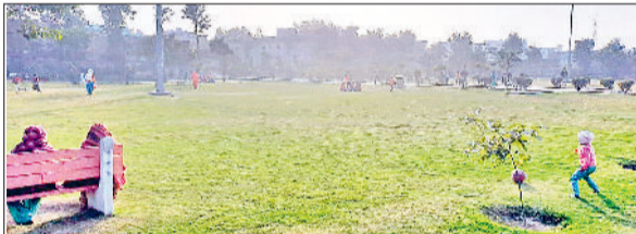
झज्जर। धूप निकलने के बाद पार्क में बैठे लोग और खेलते हुए बालक।

दृश्यता करीब बीस से तीस मीटर तक ही रही। जिसके कारण वाहन चालकों को अपने गंतव्य पर पहुंचने के लिए काफी परेशानियों का सामना करना पड़ा। लेकिन दोपहर बाद हल्की धूप