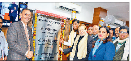
झज्जर। विकास योजनाओं व परियोजनाओं का शुभारंभ करते हुए सांसद डॉ. अरविंद शर्मा।

झज्जर। सीएम मनोहर लाल ने बुधवार को हिस्सार से वसी के माध्यम से जिले में साढ़े 14 करोड़ रुपये से अधिक की पांच योजनाओं का उद्घाटन और 90 लाख रुपये की एक परियोजना का शिलान्यास किया। जिला स्तरीय कार्यक्रम में सांसद डॉक्टर अरविंद शर्मा ने बतौर मुख्यातिथि शिरकत की। सांसद ने कहा कि देश और प्रदेश की अर्थव्यवस्था इंफ्रास्ट्रक्चर पर निर्भर होती है। इंफ्रास्ट्रक्चर जितना मजबूत होगा, देश की अर्थव्यवस्था भी सशक्त होगी। सीएम ने शहरी स्थानीय निकाय विभाग की बेरी शहर में हर्बल पार्क से शिव चौक वाया तिकोना पार्क तक की सड़क और माता भीमेश्वरी देवी मंदिर के समीप धर्मशाला का लोकार्पण किया। गांव खाचरोली स्थित राजकीय वरिष्ठ माध्यमिक विद्यालय में कमरों और शौचालयों, मातनहेल में ब्लाक कार्यालय भवन और गांव जैतपुर में उप स्वास्थ्य केंद्र का उद्घाटन किया। गांव खुड्डन में प्राइमरी स्कूल में क्लास रूम