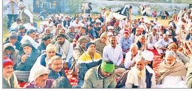
बहादुरगढ़। खरहर में बुधवार को हुई महापंचायत में शामिल किसान।

दरअसल, किसानों को बिना मुआवजा दिए ही गांव रिवाड़ी खेड़ा, खरहर, बिरधाना, रोहद, दहकोरा, मातन व छारा आदि के खेतों में 765केवी की पाँवर ग्रिड लाइन बिछाने के विरोध में