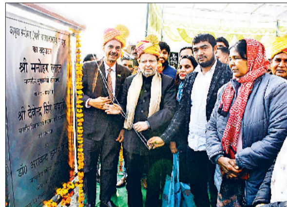
झज्जर। अमृत प्लस सरोवरों का उद्घाटन करते हुए सांसद डॉक्टर अरविंद शर्मा।

छारा में मिशन अमृत सरोवर के तहत छह अमृत प्लस सरोवरों का शुभारंभ हुआ। कार्यक्रम में सांसद डॉक्टर अरविंद शर्मा ने बतौर