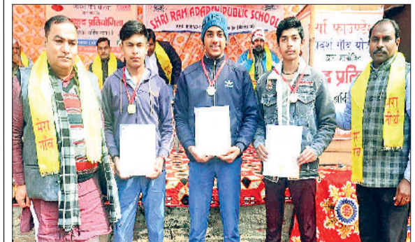
बहादुरगढ़। विजेता खिलाड़ियों को पुरस्कृत करते आयोजक।