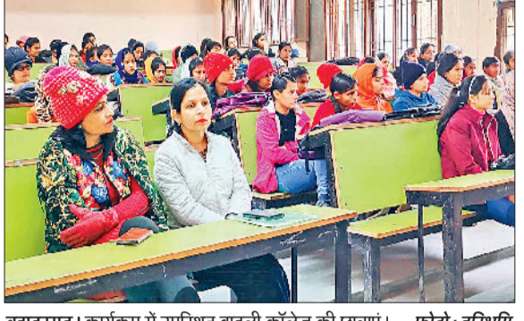
बहादुरगढ़। कार्यक्रम में उपस्थित बादली कॉलेज की छात्राएं।